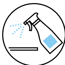
MAIOR E FREQUENTE LIMPEZA